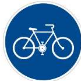
C8a-stezka pro cyklisty